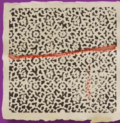
< Broderie sur papier par Özden Dora CLOW