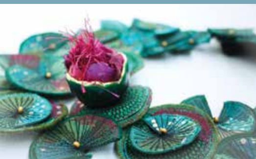
MADMOISELLE D'ANGE, bijoux textiles