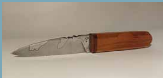
ATELIER LA BIGORNE, coutelier forgeron (Jeune Talent)