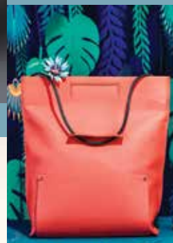
S.DANJOU, créatrice maroquinerie