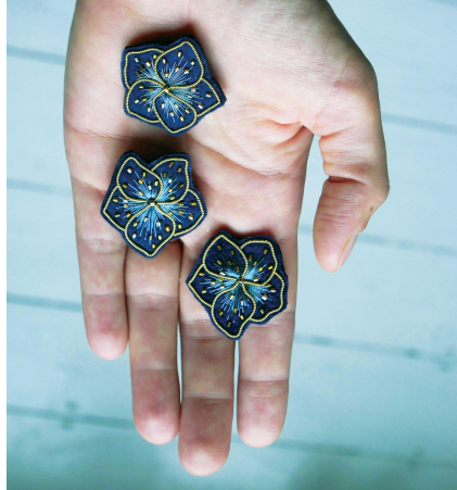
Belinda Pollard, brodeuse