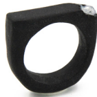
NDK Céramiques, céramiste

Angélique ZRAK - Tisserande passementière